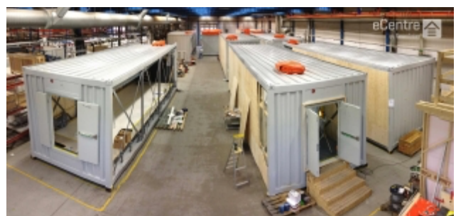
Produktion i Vara av av eCentre, tillväxtbolaget Flexenclosures världsledande produkt på den snabbväxande marknaden för prefabricerade modulära datacenter.

Ett exempel är Alelion, vars försäljning gynnas av en övergripande trend mot elektrifiering av fordon och där bolagets energisystem bidrar till att skifta användare från dieselmotorer och bly/syra-batterier till de mer miljövänliga litiumjonbatterierna – och samtidigt möjliggör besparingar för kunden på hundratusentals kronor per truckenhet.