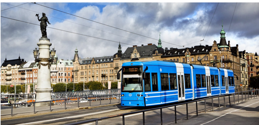
En av Stockholms Spårvägars spårvagnar på Djurgårdsbron

Bolaget grundades 2008 och driver sajterna Nyheter24, Modette, Fragbite, Blogg.se, Tyda, Hamsterpaj, Filmtipset och Dayviews. Gruppen har närmare 10 miljoner besök på sina sajter varje vecka och är Sveriges största digitala mediehus mot målgruppen 15 – 24 år. Gruppen äger dessutom Netric Sales som hjälper publicister att optimera annonsintäkter med programmatisk annonshandel, och Adwell, ett säljbolag inom databerikad annonsförsäljning. Bolagets omsättning under första kvartalet 2018 uppgick till 75,0 Mkr och EBITDA till 0,0 Mkr (0,0 Mkr). Nettokassan per den 31 mars 2018 uppgick till 8,2 Mkr (8,5 Mkr).