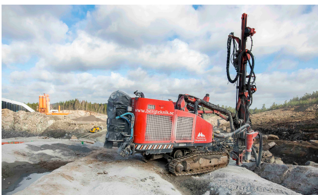
En borrhög från Norrbottens Bergteknik, ett av Nordisk Bergtekniks dotterbolag. Nordisk Bergteknik är exempel på ett navbolag i Basportföljen, runt vilken Pegroco gör tilläggsförvärv.

I kategorin Tillväxt finns ett flertal teknikbolag. Pegrocos investeringar är i dessa baserade på att tekniken skall erbjuda kunden en stor ekonomisk beräkningsbar nytta, den skall ha god skalbarhet, substansiella konkurrensfördelar, samt att den gärna skall ha en inriktning på miljö, d.v.s. bolagets marknadspenetration skall främjas av en underliggande miljötrend. Tekniken skall själv då bidra till en bättre miljö.